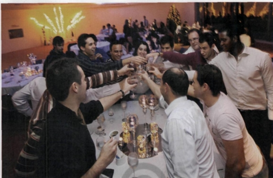
Os Óscares são um dos momentos altos do ano e distinguem os melhores do ano anterior

"Os negócios da minha empresa são conduzidos de forma ética."